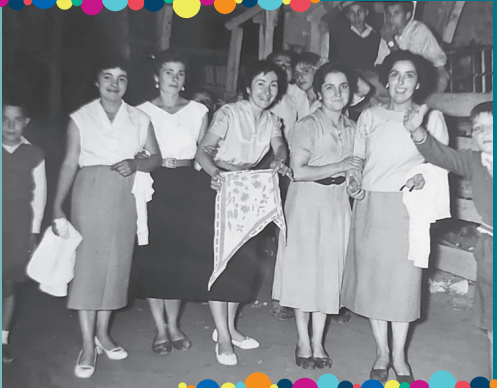
Grupo de amigas en las fiestas. Años cincuenta.