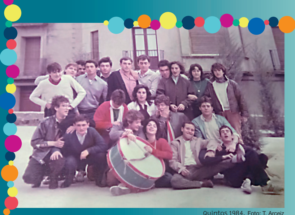
Quintos 1984.