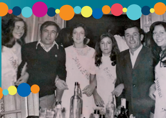
La Reina de las Fiestas y sus Damas en el ayuntamiento. Años setenta.