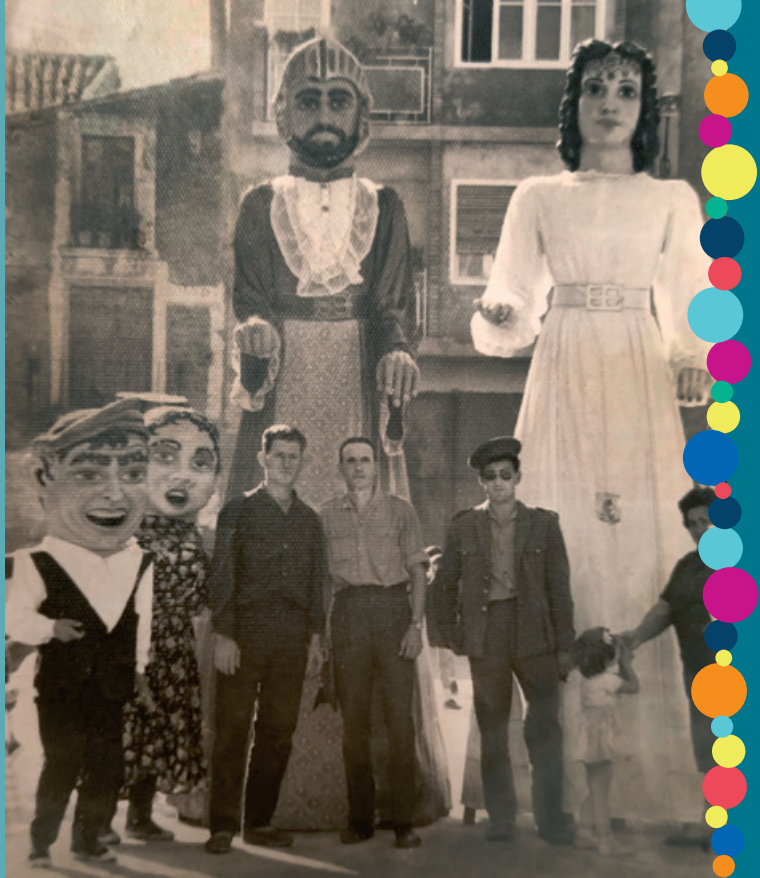
Alguaciles municipales con los Gigantes y Cabezudos. Años sesenta.