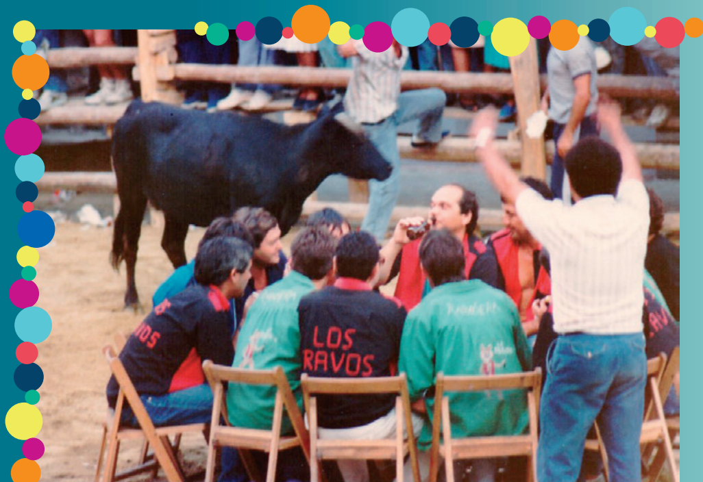
Los jóvenes de las peñas jugando a silla-vaca en la plaza. Años ochenta.