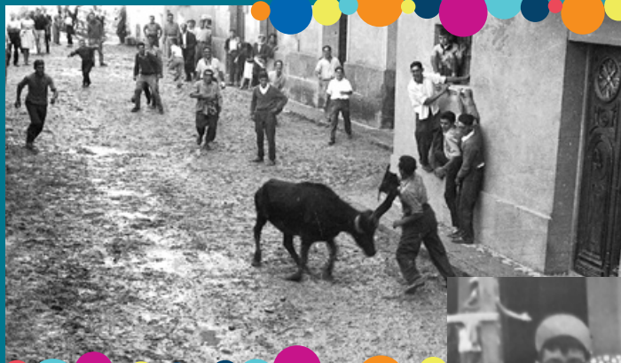
¡Y sin lavadora! Finales de los cincuenta.