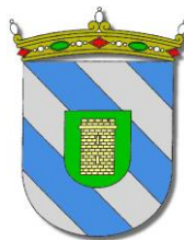
Ayuntamiento de Biota