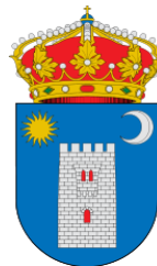
Ayuntamiento de Layana